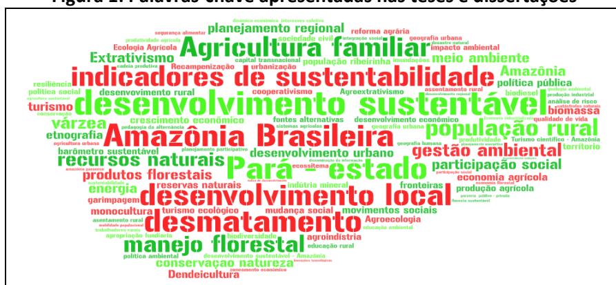
Figura 1: Palavras-chave apresentadas nas teses e dissertações

econômica e ambiental da Amazônia. Neste estudo, somadas às dissertações e teses, esse programa responde por 23 das 61 ocorrências levantadas.