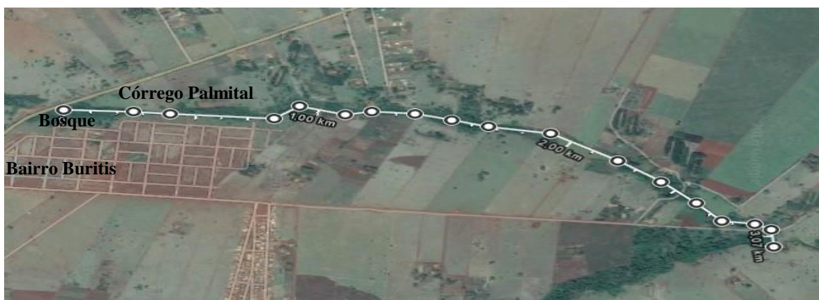
Figura 1. Área de estudo

A pesquisa é de natureza descritiva, com abordagem quali-quantitativa. Segundo Gil (2008), a pesquisa descritiva é caracterizada por objetivos bem definidos, métodos formais, bem estruturados e dirigidos para a solução de problemas. As pesquisas qualitativas têm em vista a coleta de informações, conceitos, costumes, hábitos e pretensões dos entrevistados (Malhotra, 2010). Já as pesquisas quantitativas são dados ou amostras coletados sobre a população (Marconi & Lakatos, 2003). O objeto de estudo foi o Bosque e o Córrego Palmital localizados no Bairro Buritis, criado em 2013 (Figura 1) na cidade de Tangará da Serra/MT, região sudoeste do Estado, coordenadas geograficamente: Latitude 14° 04' 38" Sul e Longitude 57° 03' 45" Oeste (Tangará da Serra, 2014).